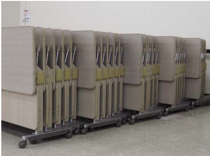
種類別に台車に積んでください。