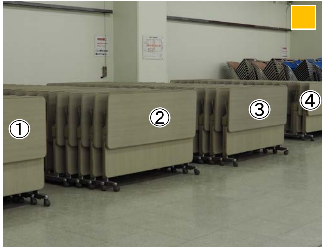
天板を天井に向け、積み、台車を元の位置に戻して下さい。