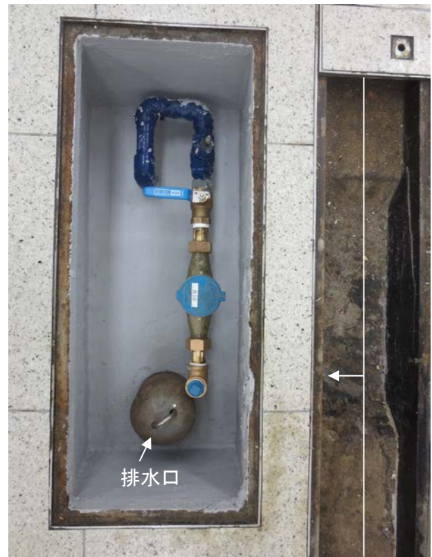
フック (防災センター保管)